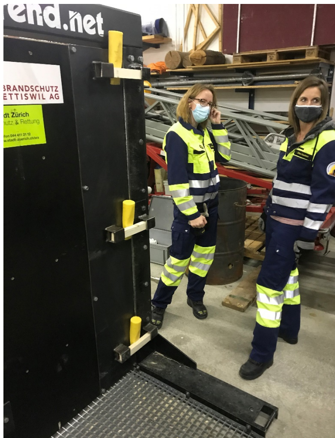
Spezialausbildung «Tür-Öffnung» Frauen-Power