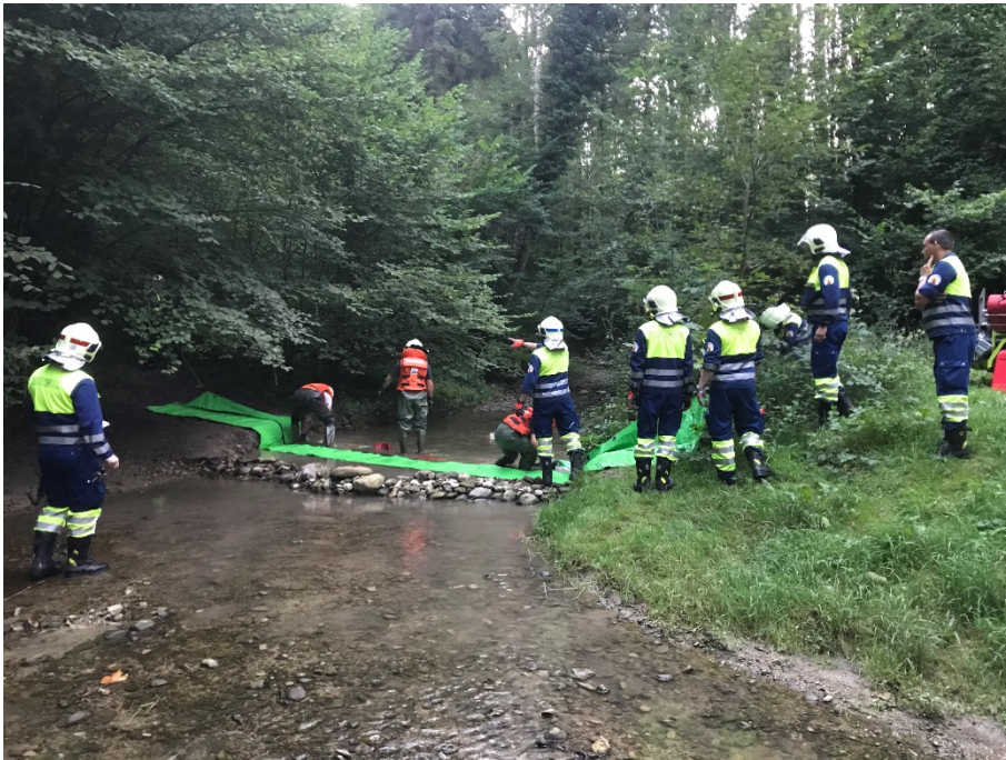
Einbau der Wassersperre