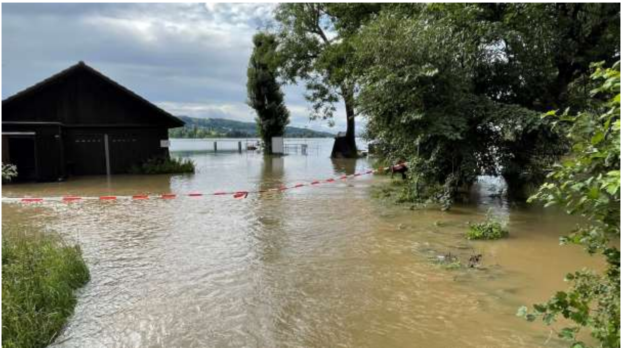
Hochwasser am Aaspitz