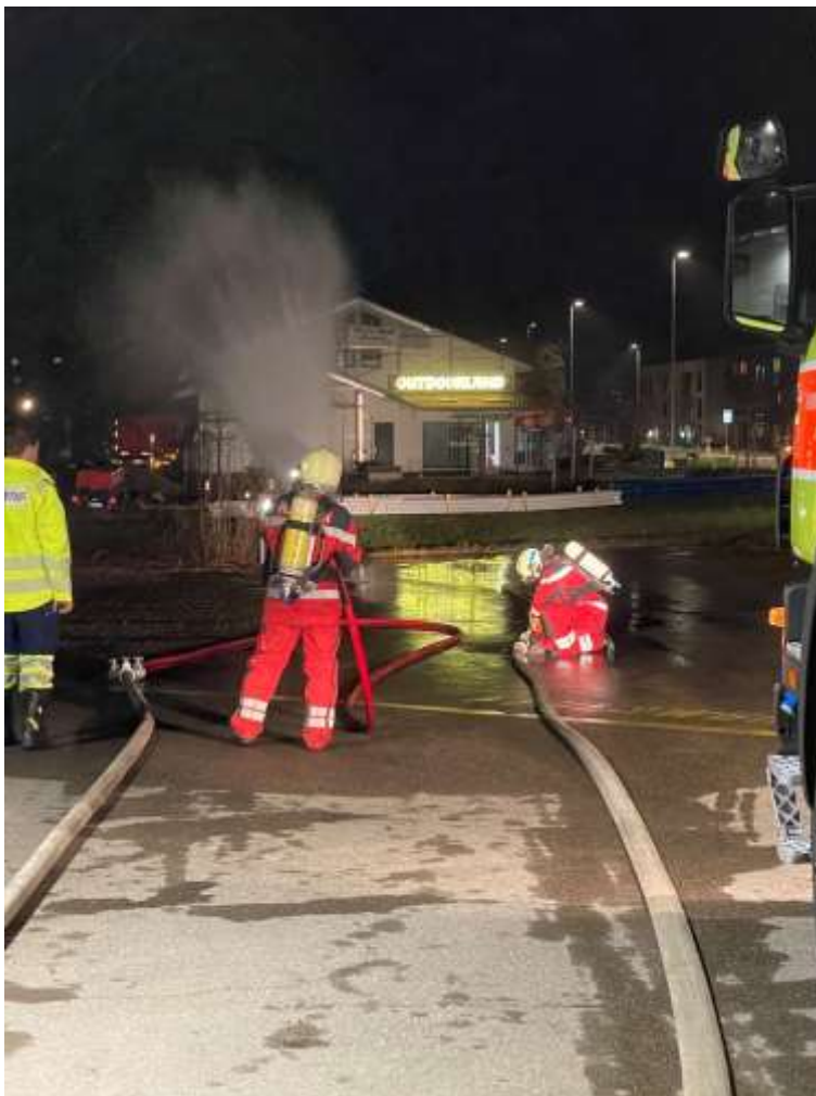
Vorwärts marsch mit Wasserabgabe