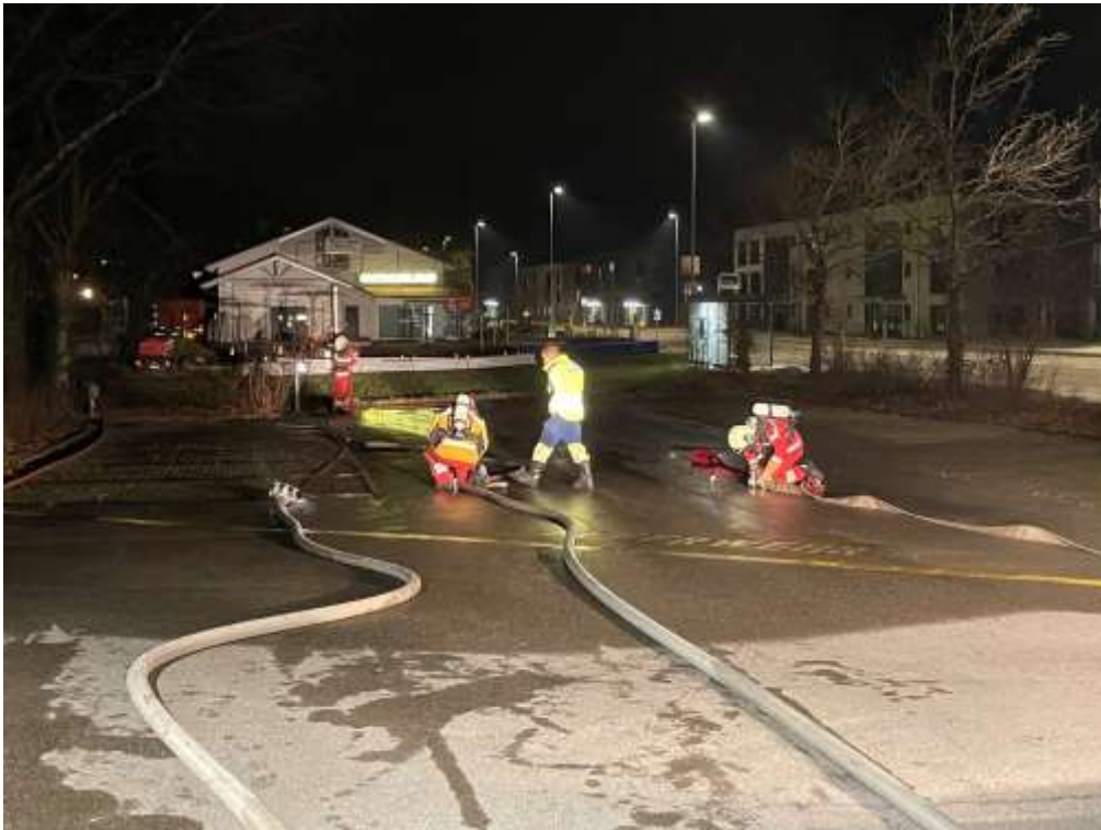
Atemschutz-Test «Wo stehe ich»