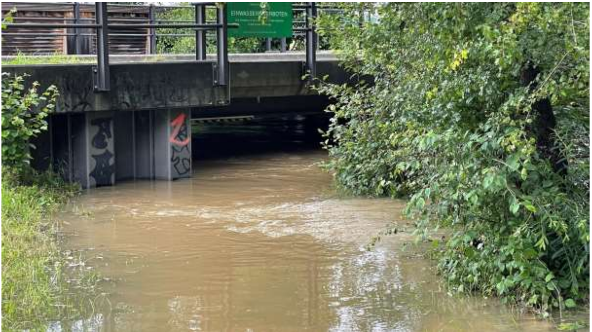
Hochwasser beim der Silberweide