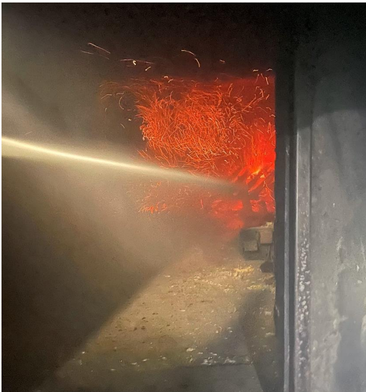
«Langer Anmarsch» und Löschen des Feuers