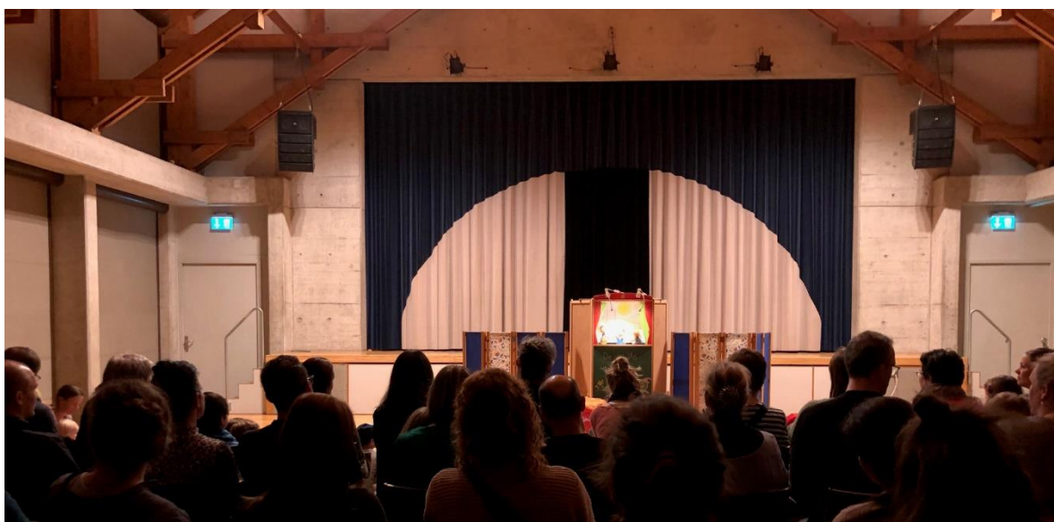
Foto: Kasperltheater am Biblioweekend 2023