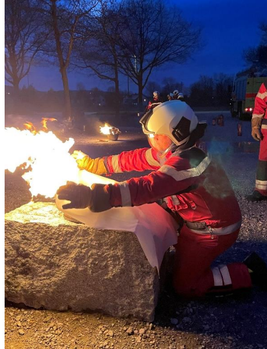
Löschen eines Pfannenbrand mit der Löschdecke.