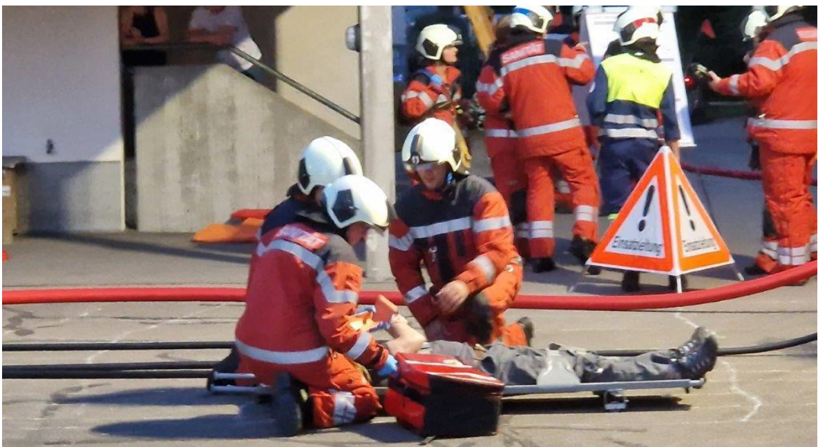
Betreuung vom Patienten