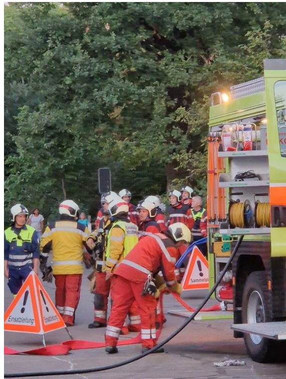
Einsatzleitung und Sammelplatz