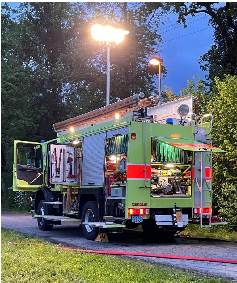
Tanklöschfahrzeug (TLF) im Einsatz