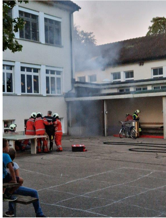
Bergung der eingeschlossenen Personen und Betreuung