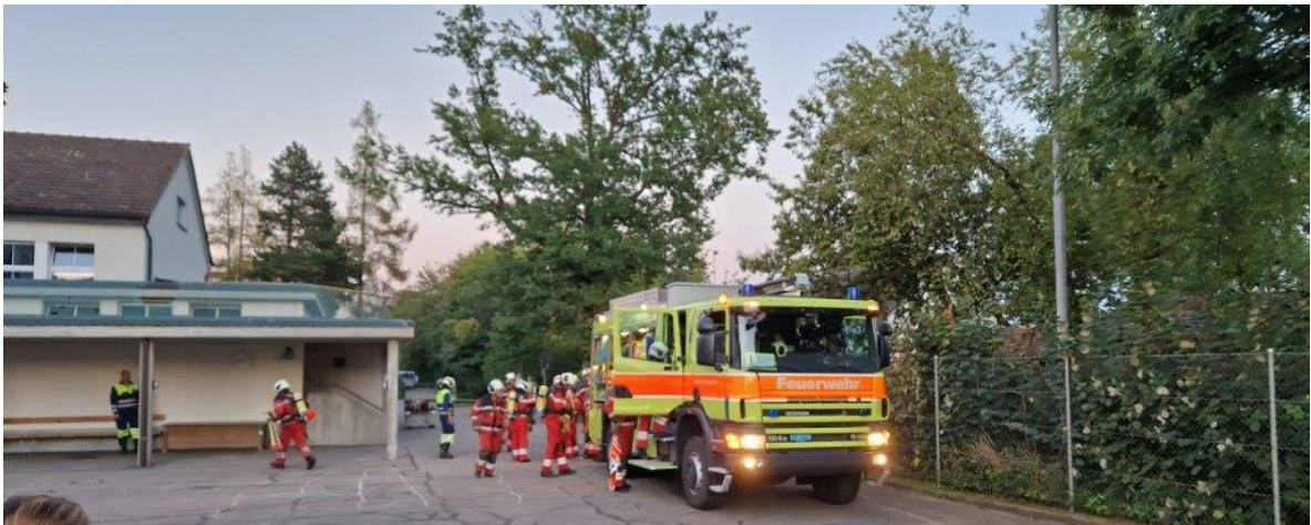
Anfahrt zum Ereignis und erste Entscheidungen