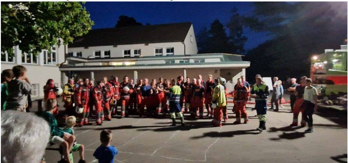
Schlussbesprechung nach dem Einsatz