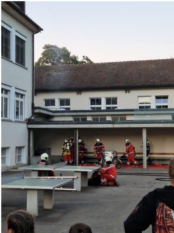
Start für den Einsatz im Haus