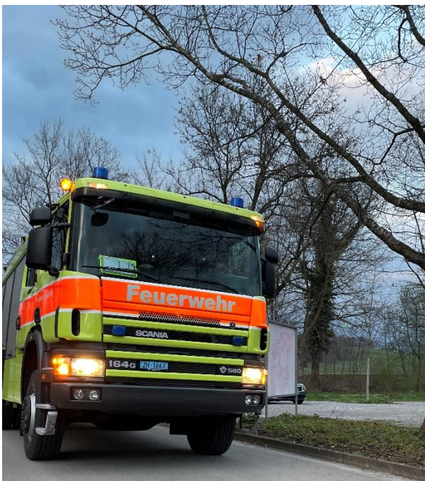
Anfahrt zum Übungsort und Horizont Erweiterung in der Funktion «Einsatzleiter», als Gruppenführer (Uof)