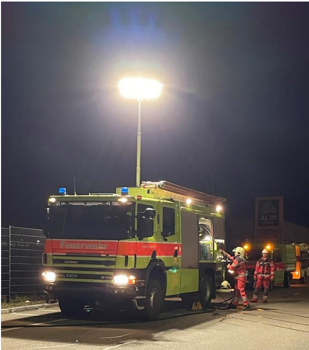
Beleuchtung des Schadenplatzes mit dem eingebauten Beleuchtungsmasten.